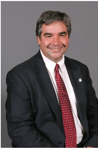
L'honorable Peter Van Loan Ministre du Commerce international